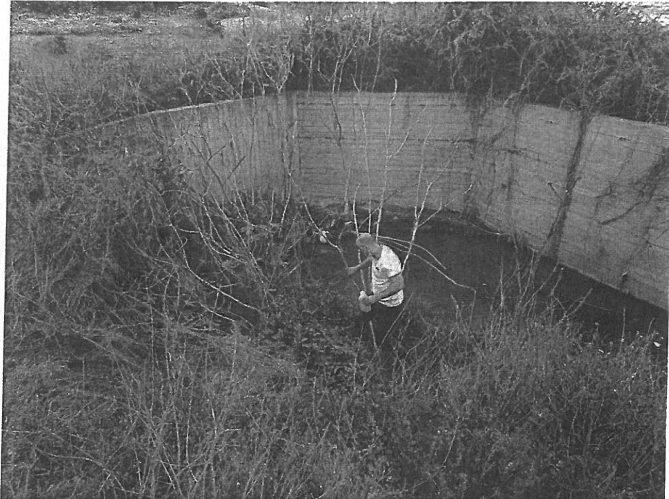
תמונה 3 : ביוביט מי און חדרה בת"ש דרומית אולגה ( 22.03.2021)