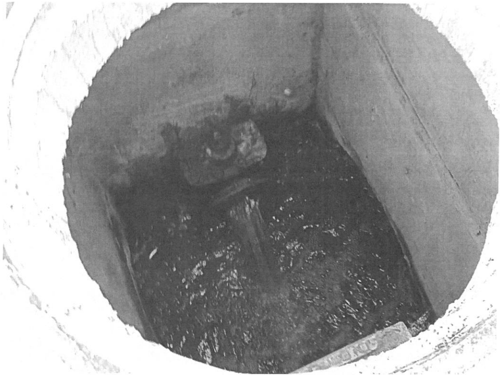
תמונה 5 : ניסיון לסגור את ברוז הניקוז ולקיחת דוגמה נוספת